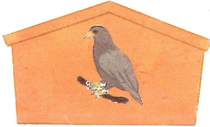
鷹(たか)の絵馬のイメージ図